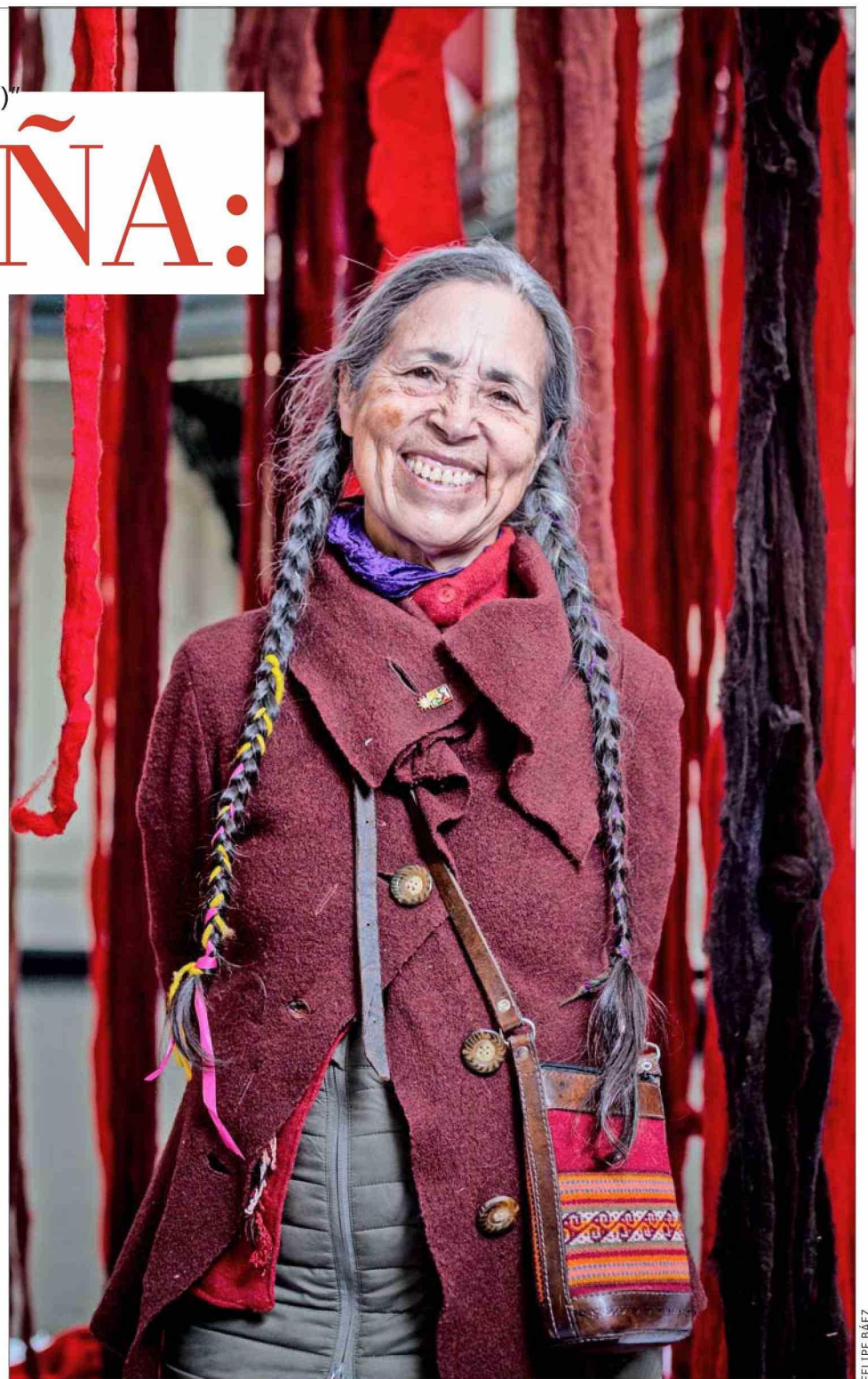
La artista, durante el montaje de "Quipu menstrual (la sangre de los glaciares)", en el Museo Nacional de Bellas Artes. Su retrospectiva abrirá al público el jueves 11, a las 15:00 horas.

"Lo que puedo decir ahora es desde la memoria de mi imaginación y sentir, porque eso sucedió cuando era adolescente. No es posible reconstruir lo que pude sentir frente a un quipu reproducido en un libro. Pero puedo imaginar. Crecí rodeada de hilos porque mi mamá tejía y yo he escrito poemas en los que soy una bebida que va gateando a jugar con los hilos. Creo que conecté los hilos con el cosmos, los cielos y la luz desde entonces. Cuando vi el quipu debo haber conectado a un nivel muy visceral con lo que se llama la morfología del