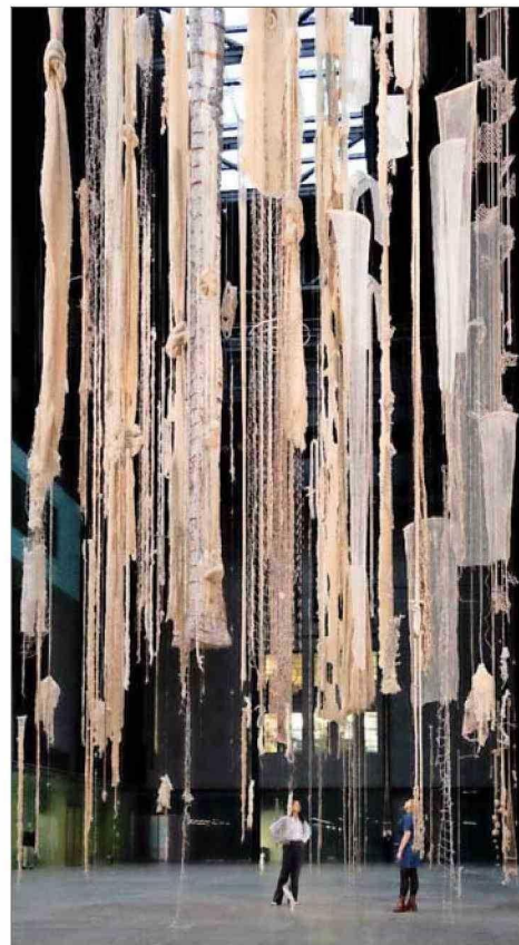
"Brain forest quipu", la obra multidimensional que Vicuña creó para la Turbine Hall de la Tate Modern (Londres) contempla además un quipu monumental.

quipu. Es decir, la configuración de una hebra retorcida, que está enredada, que no es una línea, sino un atado. Porque en mi poesía tú encuentras constantemente esa imagen del enredo y esa torsión de la conexión con el cielo, la luz, el hilo de agua y el hilo de vida. No fue algo pensado trabajar con el quipu, por ejemplo, porque fue suprimido. Más bien, sentí que entre el quipu y mis manos había una relación tan profunda. Yo pertenecía al quipu".