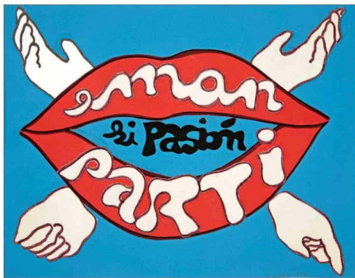
"Eman sí pasión / Partí sí pasión", 1974. Collage sobre papel.