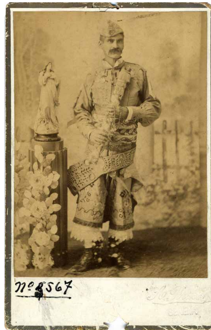
Antecedente para el trabajo en ambrotipia de Mauricio Toro Goya Laureano Barrera, fotografía de Alfredo Bravo Original de albúmina Año 1901 Colección Museo Histórico Nacional