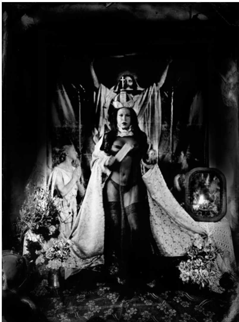
Nuestra Señora del Rosario de Andacollo (Chile)